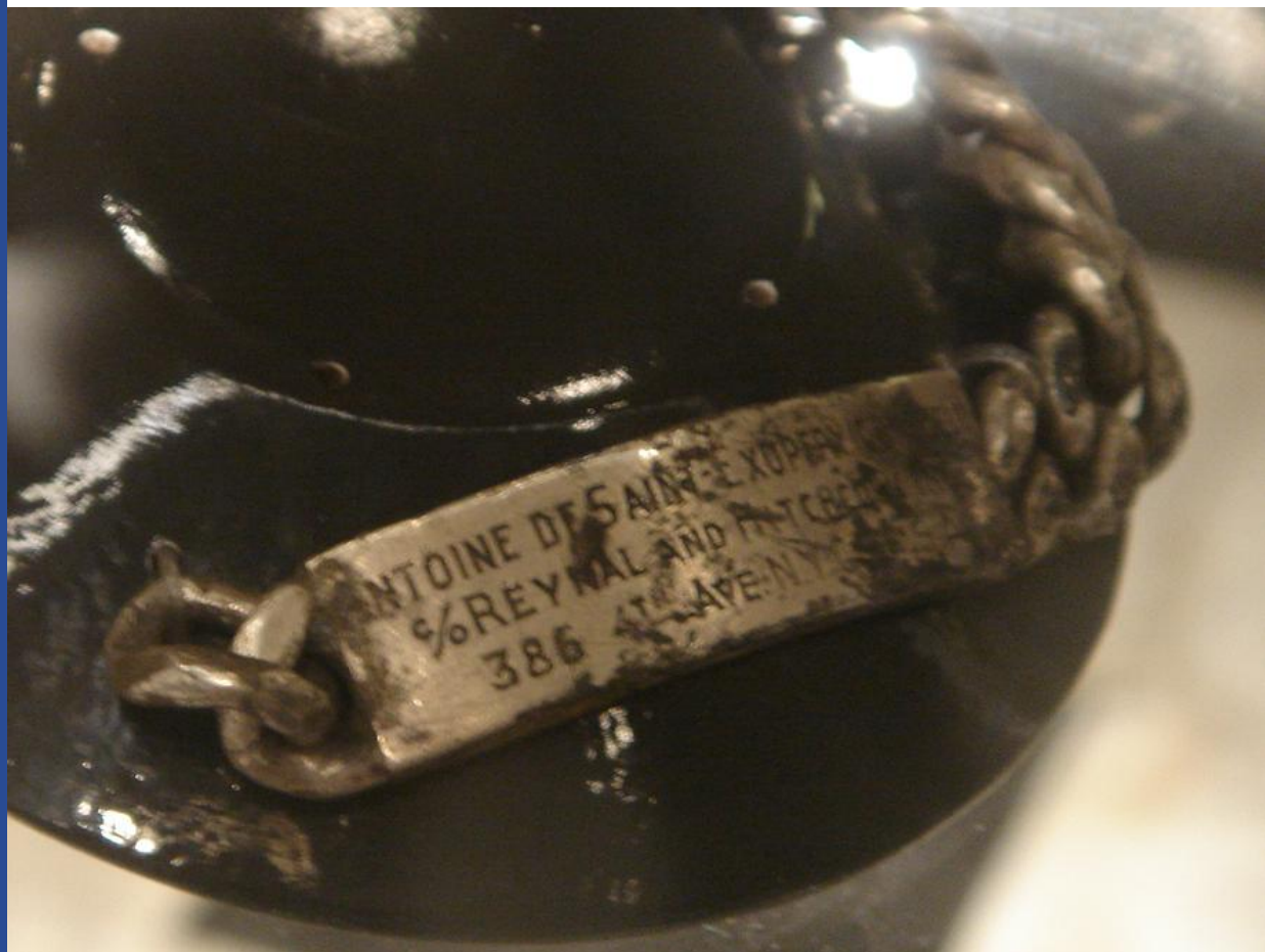
Bracelet de Saint-Exupéry trouvé par le pêcheur Jean-Claude Bianco en 1998.

Pour conclure, nous aimerions emprunter cette phrase au Petit Prince: “Quand tu regarderas le ciel, la nuit, puisque j’habiterai dans l’une d’elles, puisque je rirai dans l’une d’elles, alors ce sera pour toi comme si riaient toutes les étoiles. Tu auras, toi, des étoiles qui savent rire!”