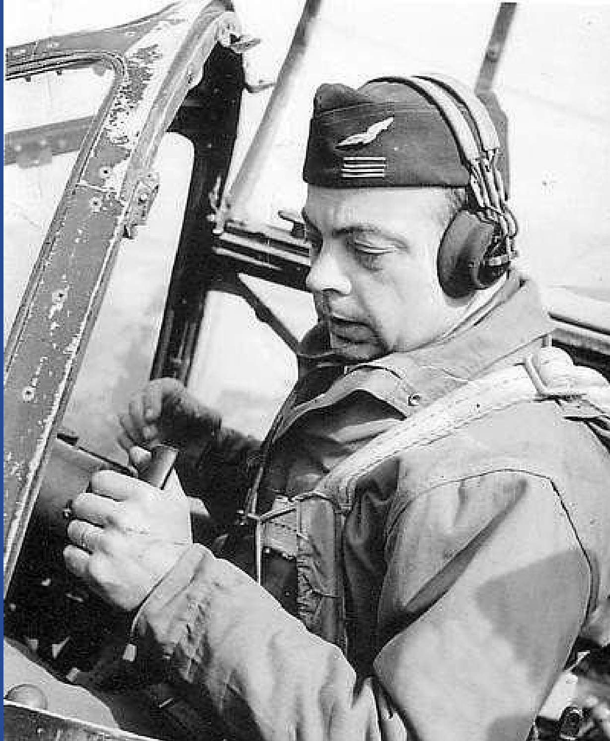
Antoine de Saint Exupéry