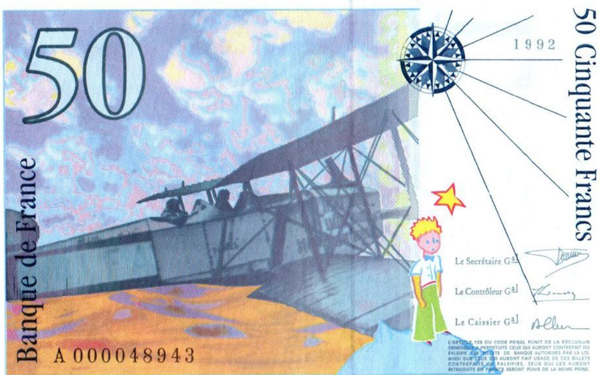
Le Petit Prince, billet de banque de 50 francs

Par la Monnaie de Paris (billet), Banque Centrale Européenne (photo) — Banque de France (billet), Domaine public