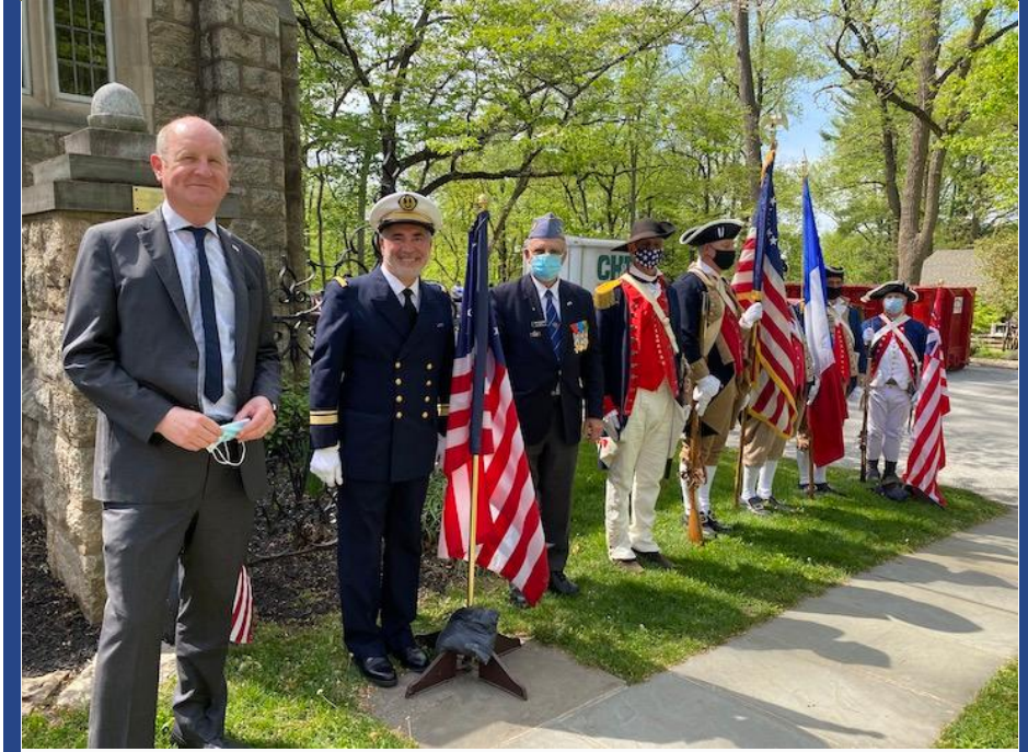
2 mai 2021 : nous avons eu l'honneur de participer à la commémoration annuelle du « French Alliance Day » à Valley Forge, en Pennsylvanie. Conformément aux instructions du général